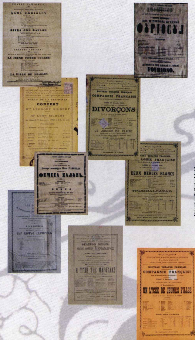
Concept grafic: Corina Irimilă